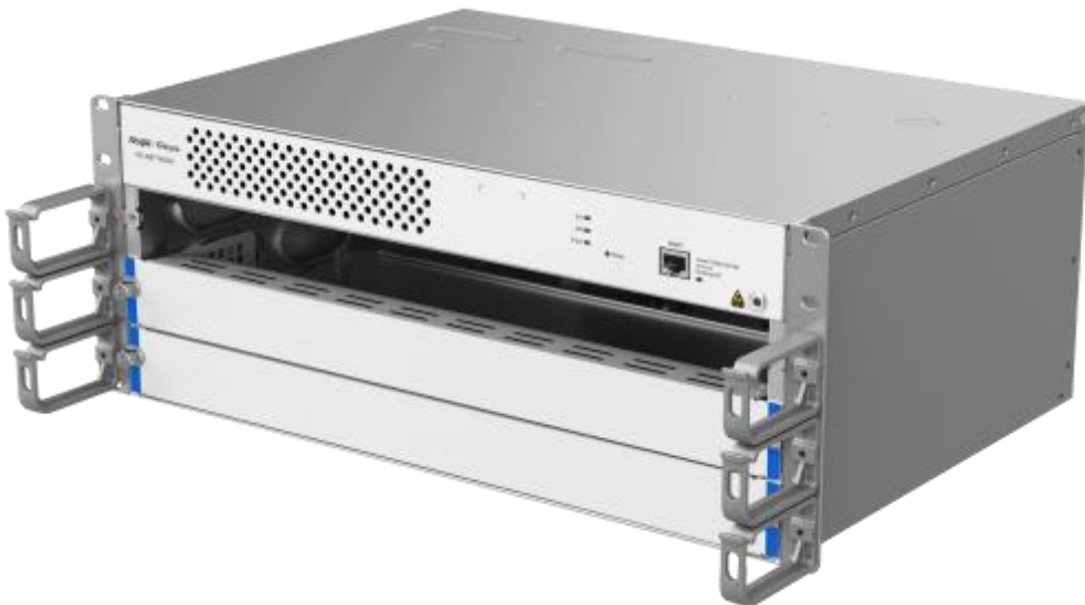
RG-NBF7003M 右侧 45 度视图