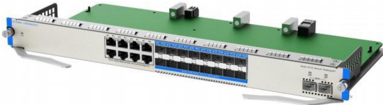
MF7000M-16MFS8MG2XS 右侧 45 度视图