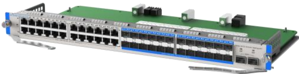
MF7000M-24FS24GT2XS 右侧 45 度视图