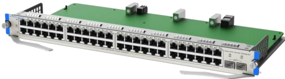
MF7000M-48GT2XS 右侧 45 度视图