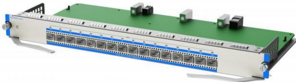
MF7000M-16XFS 右侧 45 度视图