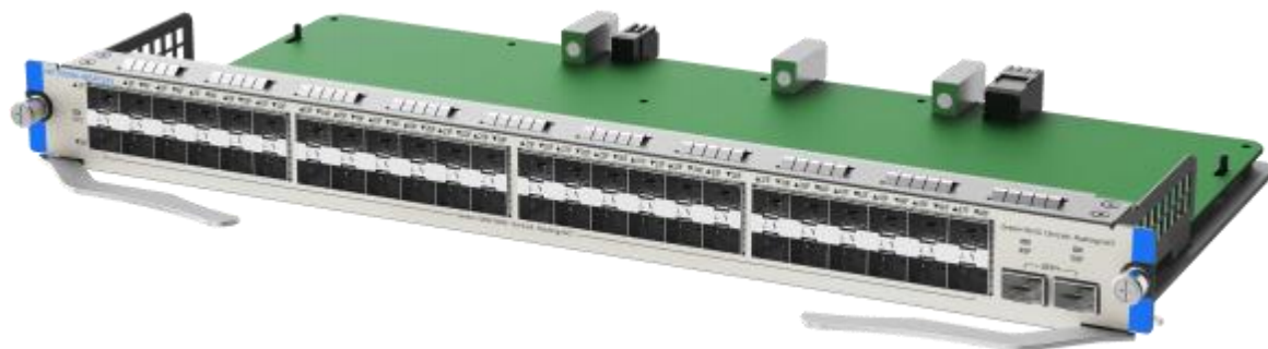
MF7000M-48SFP2XS 右侧 45 度视图